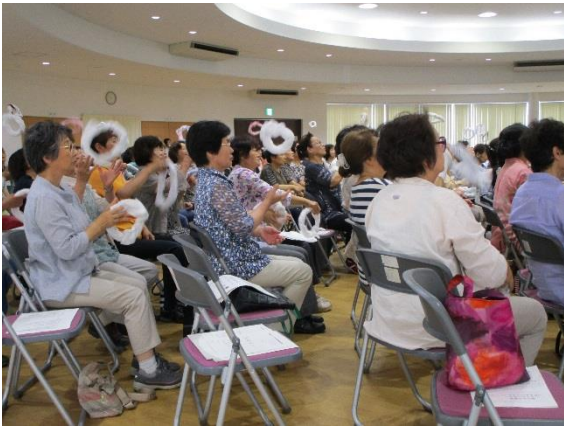
「タオルでドーナツ」体性感覚、反応トレーニング