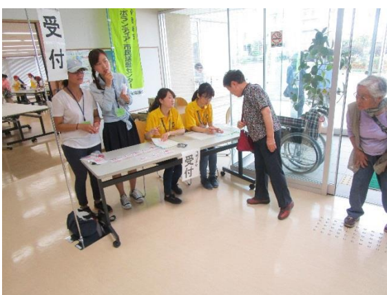
受付も手伝って頂きました