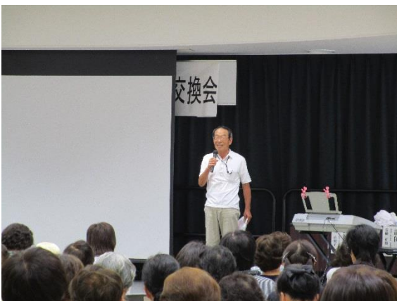
団体 PR「オレンジ SUN ほんわか」