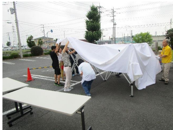
外国人ボランティアさんも参加