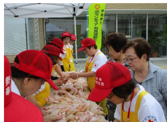
作製したお米はお持ち帰り頂きました