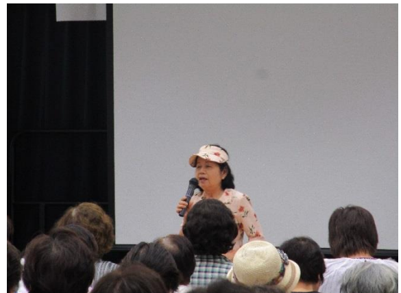
団体 PR「伊勢崎玉すだれ会」