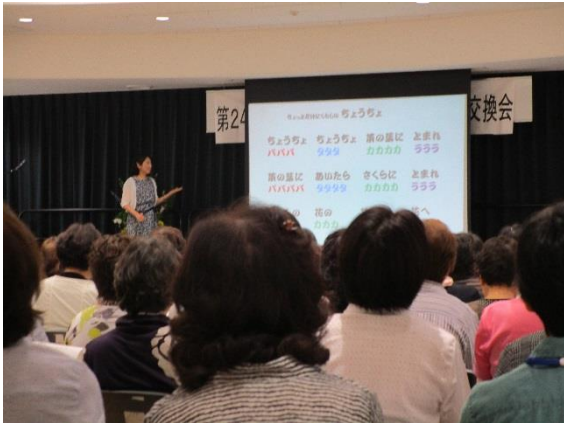
意外と難しい「パタカラ」ちょうちょ♪