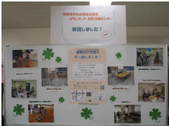
ボランティアセンター紹介パネル