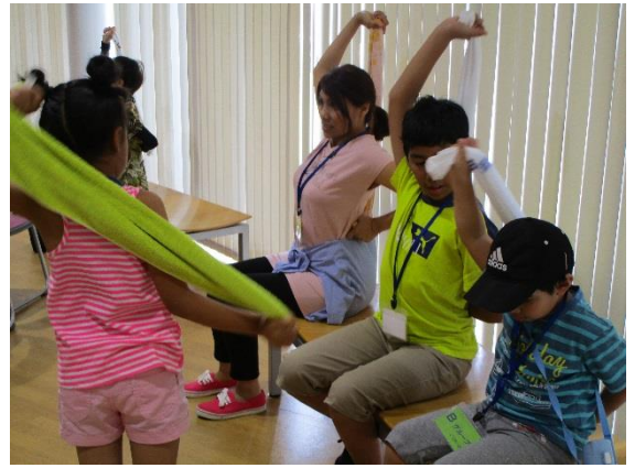
脳トレにもなる腕や肩のエクササイズ