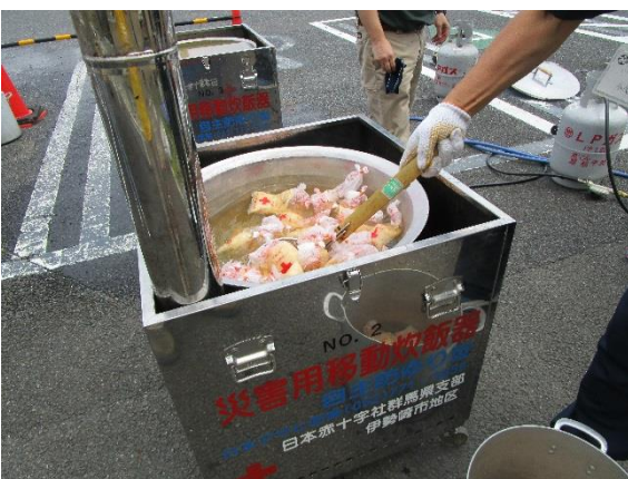
外では炊き出し作業