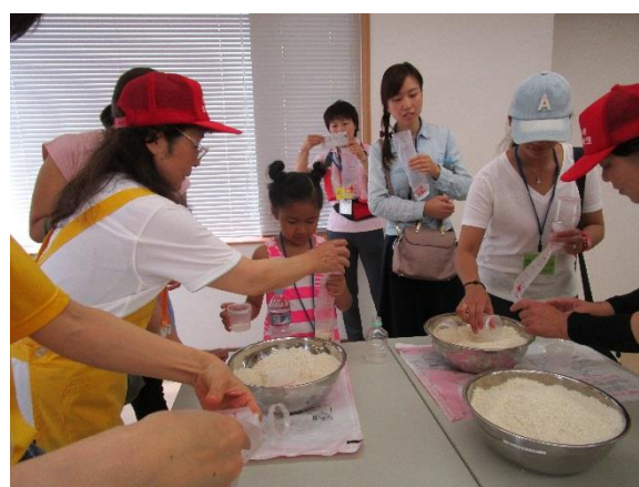
災害救助用炊飯袋の作製中