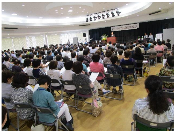
参加者で会場はいっぱいになりました