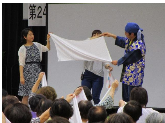
誰でもできるレクリエーション!