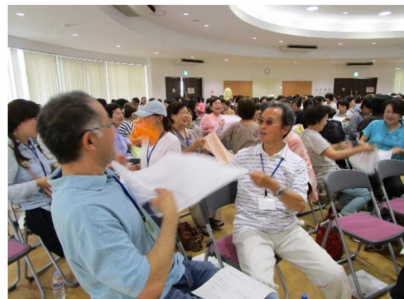
不安定な動きを楽しむ「ひもかわうどん」運動