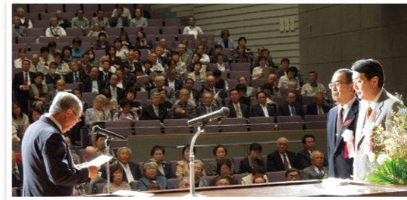
▲代表受領者からの謝辞の様子

10月12日、境総合文化センターで平成24年度伊勢崎市社会福祉大会が開催され、社会福祉に貢献された方々の表彰等が行われました。