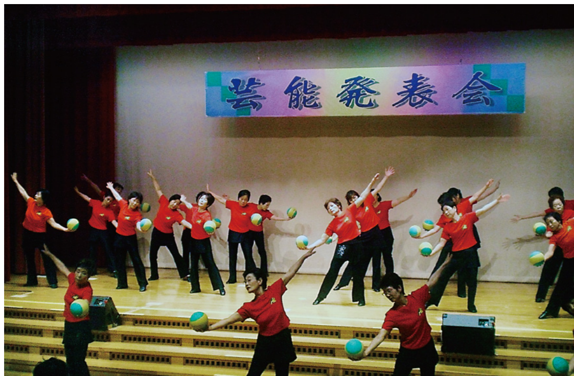
▲芸能発表会の様子

敬老の日にちなみ9月8日・9日、13日～17日に、第20回ふくしプラザフェスティバルが開催され、6,400人を超える多くの市民の方々に賑わいました。