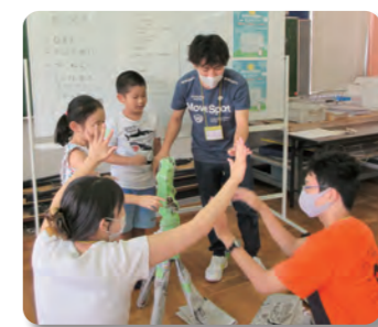
レクでみんなが笑顔になりました!

「楽しかった! また明日来るね。」元気な子どもたちの声が聞こえてきました。 暑かった今年の夏休み。宿題を持って延べ23人の小学生が児童センターに集まり、地域の学生によって楽しくそしてスムーズに宿題を仕上げることができました。 コロナによって人との交流に制限があった時期を経て、異年齢の子ども同士と地域の学生とのつながりは、みんなが歌った「にじ」にあるように「明日はみんな元気になる」ことにつながります。一生懸命頑張った宿題は、夏休みの思い出の一つになったのでしょうか。