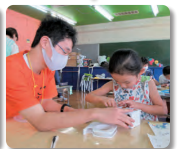
どんな貯金箱ができるのかな?