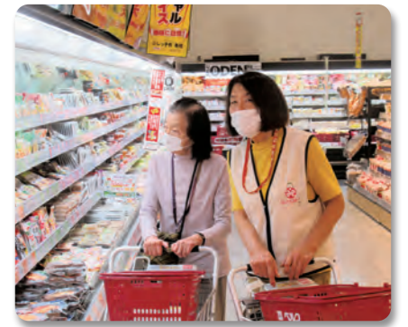
月1回実施する買い物ツアー

「免許を返納して足がない」「外出は病院に行くだけ」「自分で選んで買い物したい」グループみなみは、そんな地域の方の想いをもとに、南地区協議体＝「南十字星」の活動から生まれました。 社協の地域支え合い車両貸出事業を利用し、「病院の帰りにあの店に寄ってみたい」「みんなと一緒に花見がしたい」など利用される方の希望に寄り添いつつ、私達もこの地域で楽しく生活できるようにお互い様の精神で活動しています。