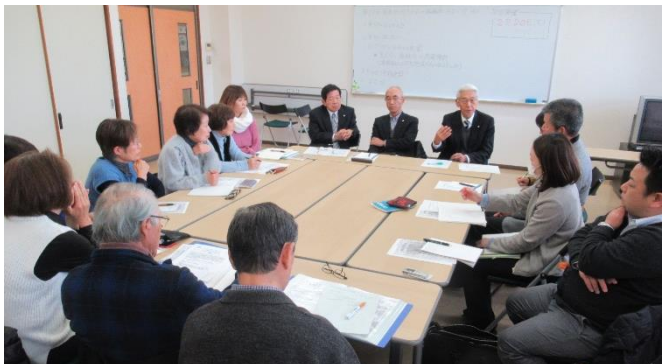
協議体の話し合いの様子