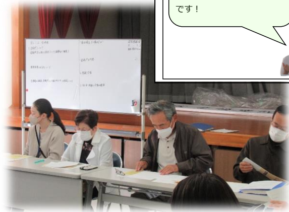
←▲協議体の話し合いの様子